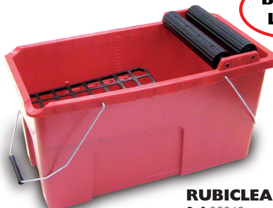
RUBICLEAN-BL Ref. 25949