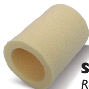
SWEEPEX® Ref. 62956