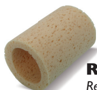
RUBINET® Ref. 62955