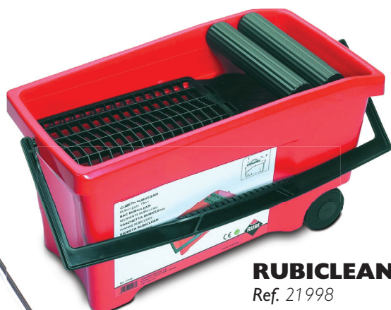
RUBICLEAN Ref. 21998