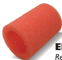
EPOXI Ref. 62957