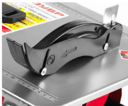
Защитный кожух диска препятствует вылету искр