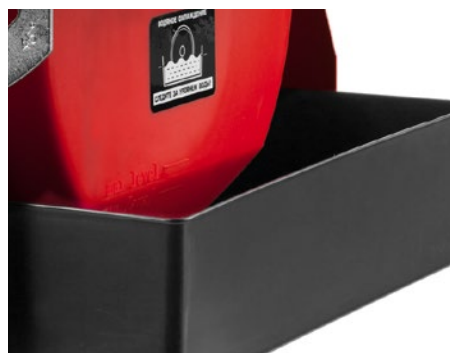
Для охлаждения диска предусмотрена специальная емкость для воды