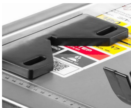
Параллельный и угловой упор с линейкой позволяют точно выставить плитку без разметки