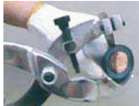
продольная резка изоляции

Инструмент СИ-30 позволяет снимать изоляцию, разрезая ее вдоль и поперек оси кабеля. Регулировкой упорного винта выставьте необходимую глубину прорезания изоляции кабеля. Расположите кабель на упоре, и, сжимая ручки, производите пошаговую резку изоляции в выбранном направлении.