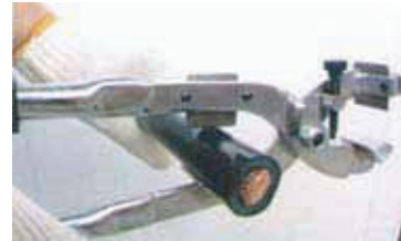
поперечная резка изоляции