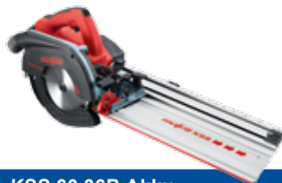
KSS 60 36B Akku