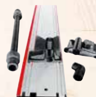
Система вакуумного крепления

Aerofix F-AF 1 с шиной, адаптером для крепления сверху и снизу, гибким шлангом № для зак. 204770