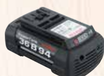
Аккумулятор PowerTank 36V