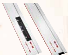
Направляющая шина F

для соединения двух направляющих шин № для зак. 204363