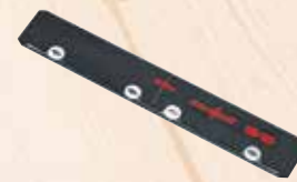
Соединительный эл-т FVS

макс. длина пропила 770 мм № для зак. 204378