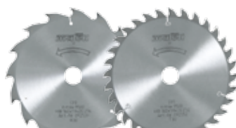
Пильные диски-НМ для KSS 60 36B

№ для зак. 092485 № для зак. 092487 № для зак. 092489 № для зак. 092491