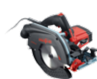
K 65 cc