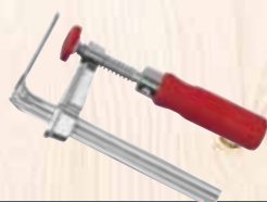
Струбцина FSZ 100MM

2 штуки, для фиксации шины на заготовке № для зак. 205399