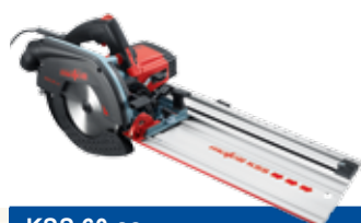
KSS 60 cc