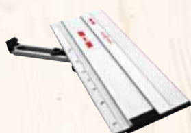
Угловой упор FWA