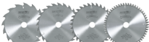
Пильные диски-НМ для KSS 60 cc / K 65 cc

Новые многофункциональные пилы класса 60/65 мм наилучшим образом оборудованы для выполнения самых разнообразных задач. Благодаря специально разработанной оснастке Вы можете использовать Вашу новую торцовочную систему и ручную циркулярную пилу для выполнения стоящих перед Вами узкоспециальных задач.